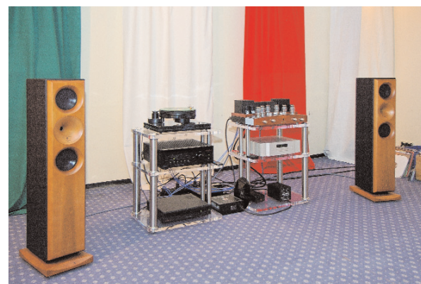
Analogue Audio Products

eerder door mij besproken Graaf GM50 geïntegreerde versterker en als heuse primeur staat ook een werkelijk imponerend vormgegeven Unison Research Performance, een 2 x 45 Watt single ended versterker met 6 KT88's aan boord. Signaalkabels zijn van HiDiamond, Deskadel en BCD terwijl een hele batterij aan Kemp lichtnetproducten is ingezet om de stroom maar vooral zo schoon mogelijk aan te leveren. De weergave die deze set weet neer te zetten is er een van ingetogen schoonheid, bezinning en warmte.