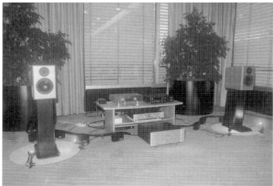
Master Three met Marsh-elektronica