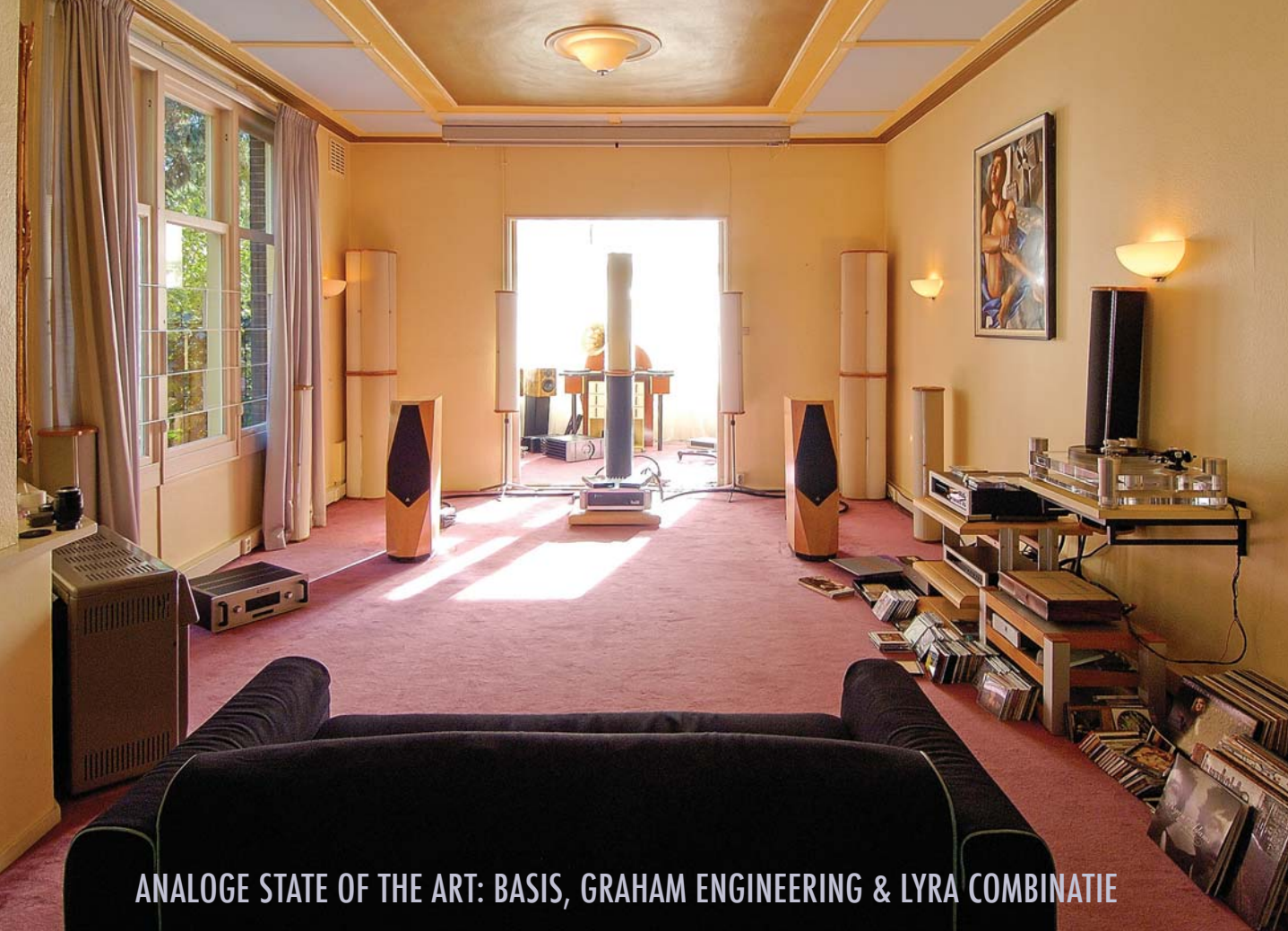
ANALOGUE STATE OF THE ART: BASIS, GRAHAM ENGINEERING & LYRA COMBINATIE